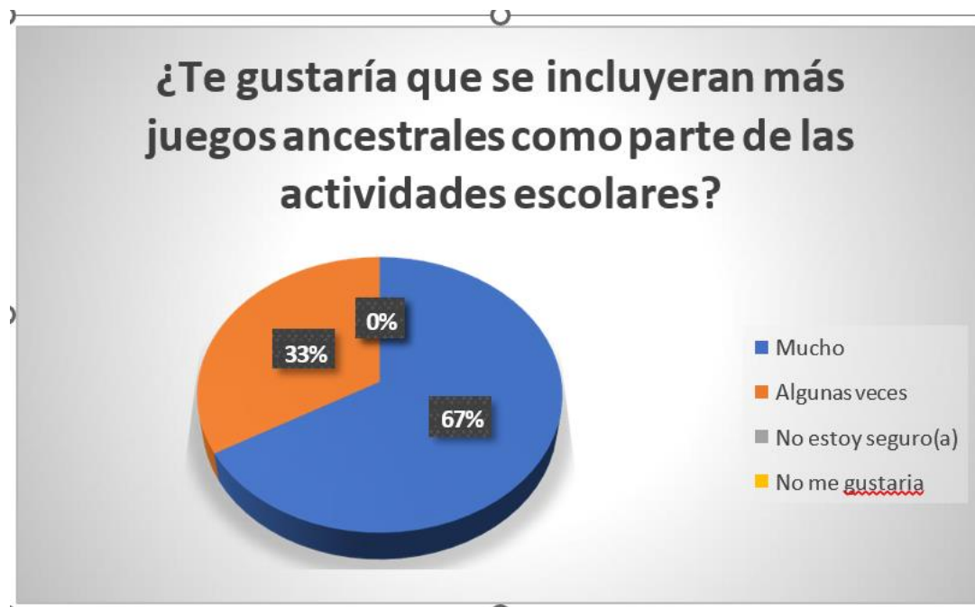
Figura 5 Inclusión de juegos ancestrales en actividades escolares. Elaborado por: Andrea Castillo