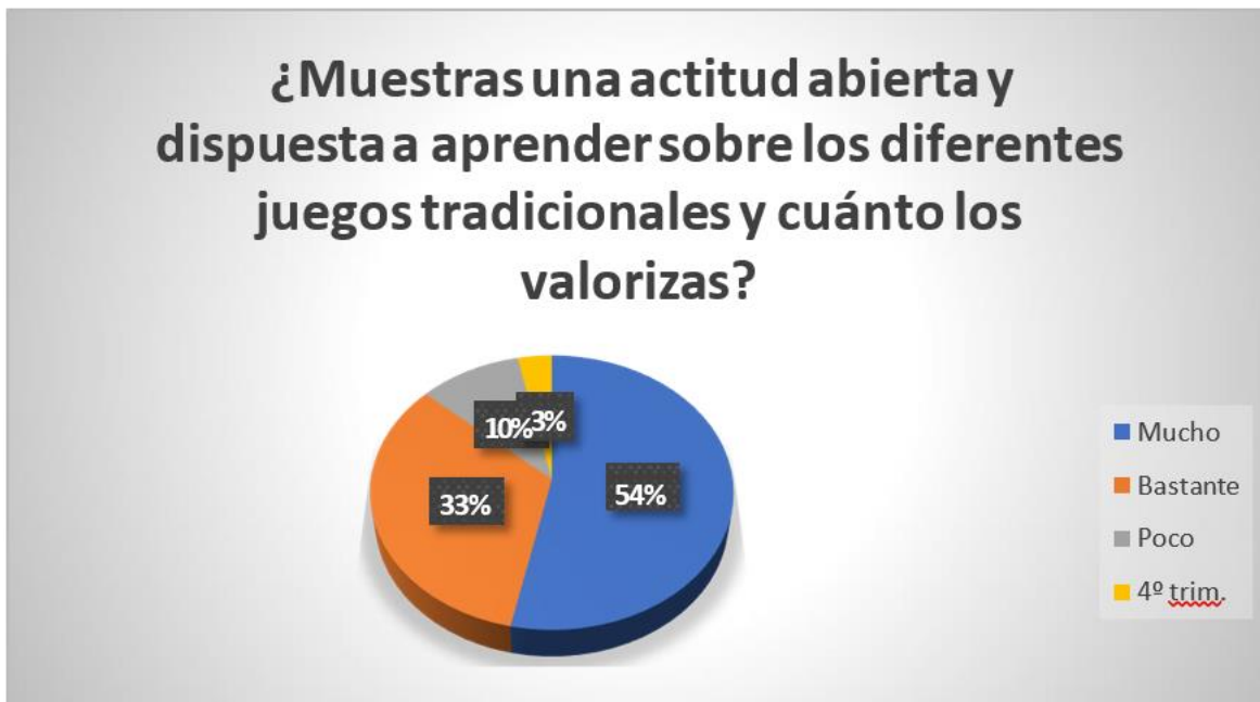
Figura 7 Aprender sobre los juegos tradiciones y su valorización. Elaborado por: Andrea Castillo