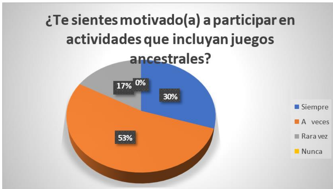
Figura 3 Motivación en actividades. Elaborado por: Andrea Castillo

Análisis. En cuanto a la tabla y gráfico N3. Observamos que el 30% han respondido Siempre, el 53% respondió A veces, el 17% ha respondió Rara vez y el 0% ha respondido Nunca. Los estudiantes de séptimo año durante sus clases a veces se sienten motivado en sus actividades.