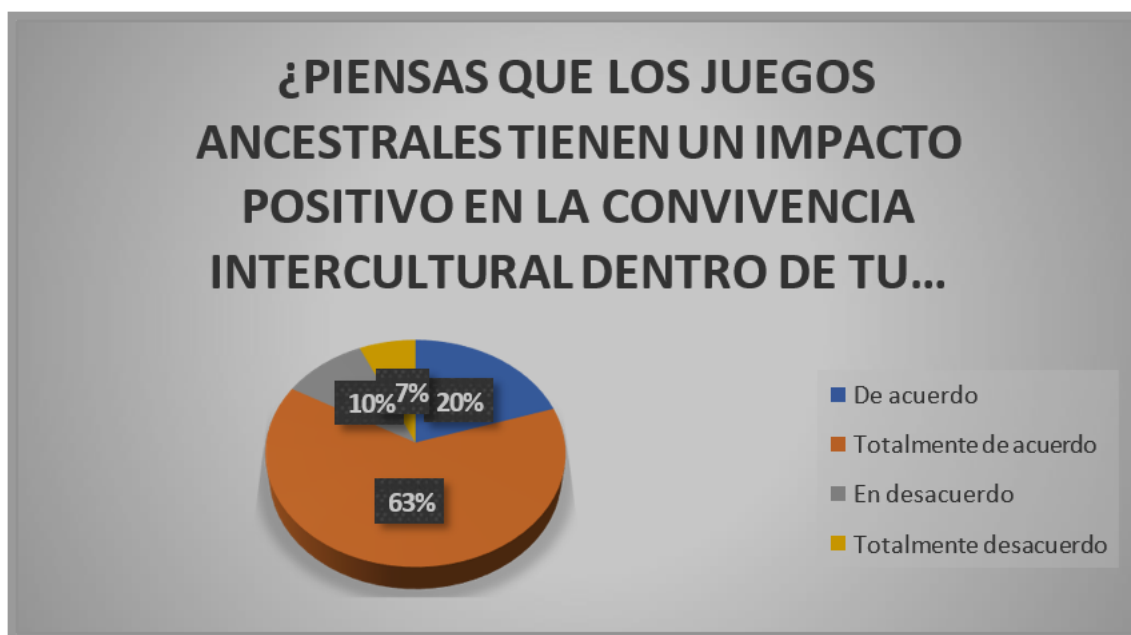
Figura 4 Impacto positivo en la convivencia escolar. Elaborado por: Andrea Castillo

Análisis. En cuanto a la tabla y grafico N4. Observamos que el 20% han respondido De acuerdo, el 63% respondió Totalmente de acuerdo, el 10% respondió En desacuerdo y el 7% totalmente