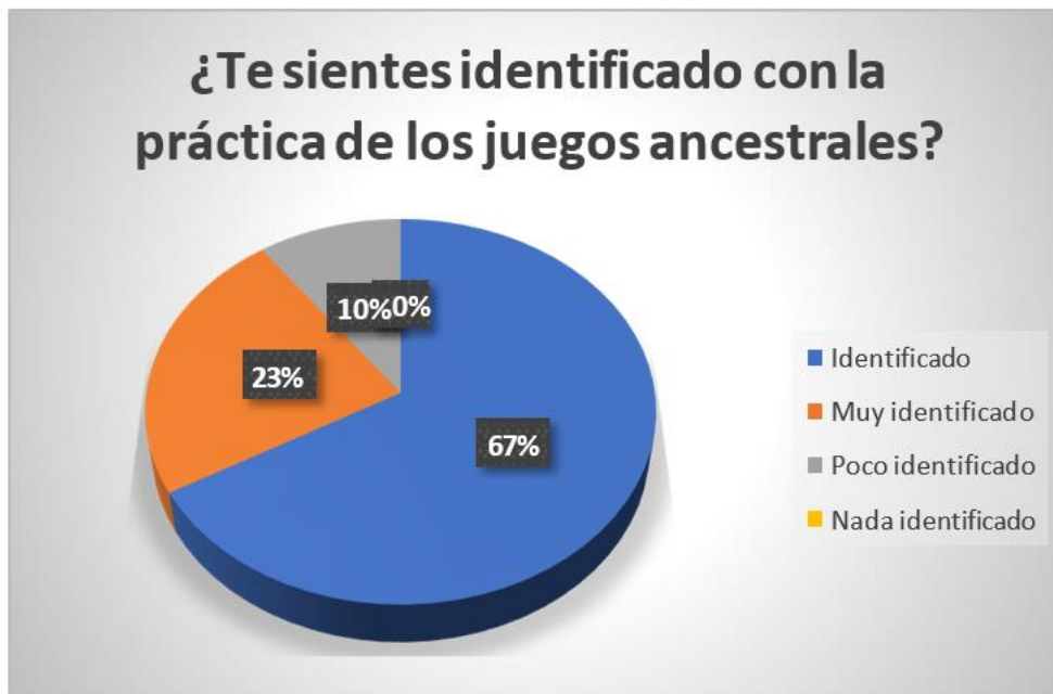
Figura 6 Prácticas de los juegos ancestrales. Elaborado por: Andrea Castillo